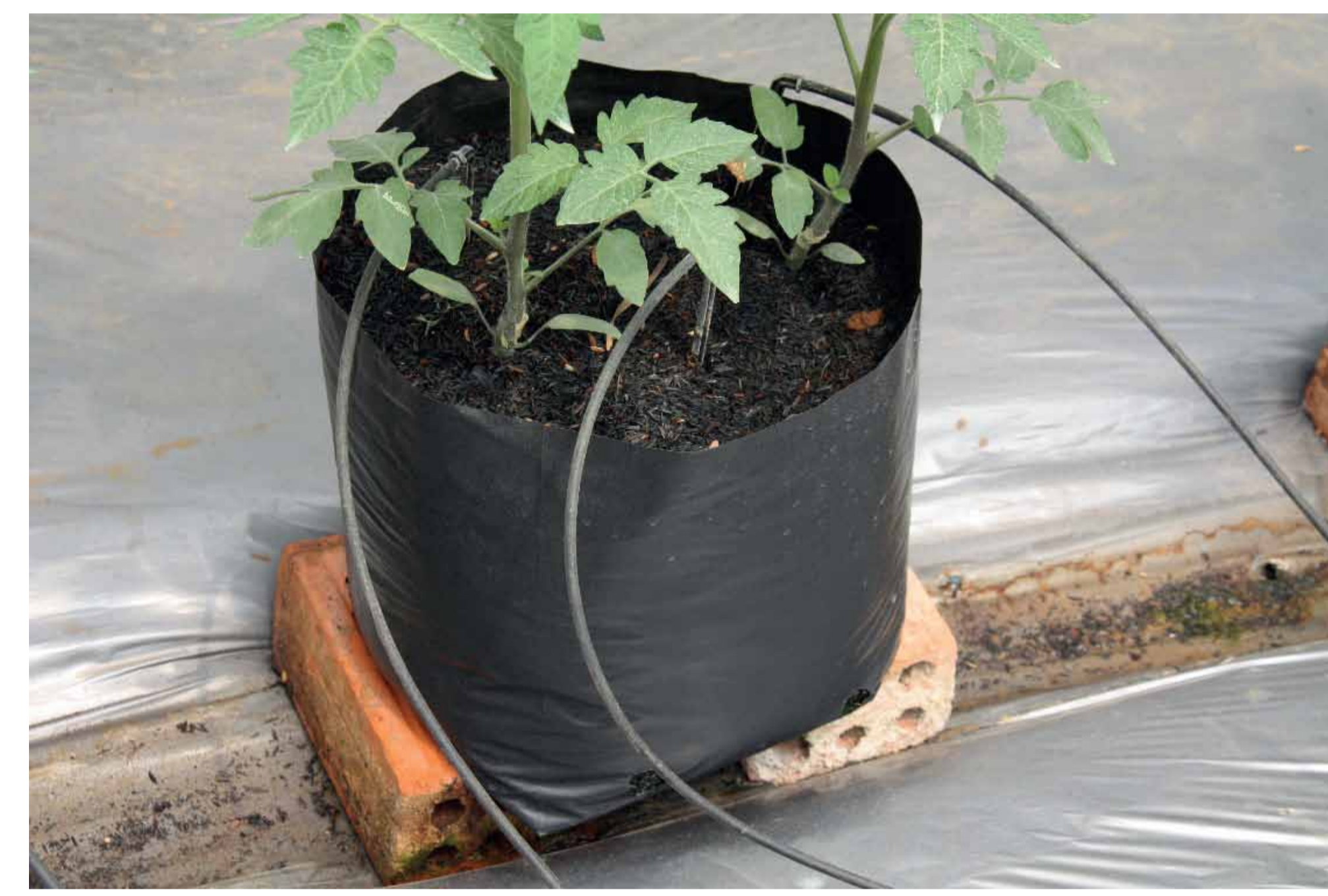
Túi giá thể và ghim tưới nhỏ giọt