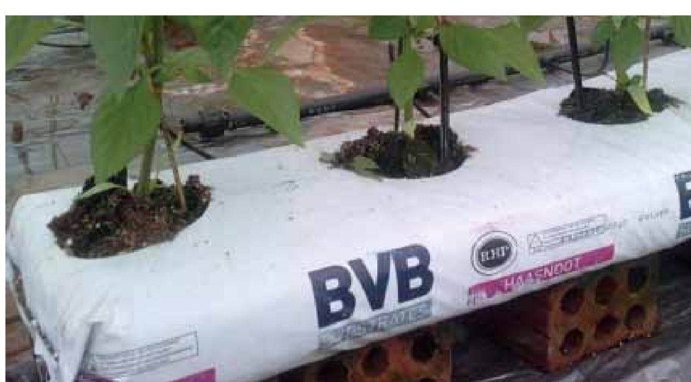
Giá thể nhập khẩu