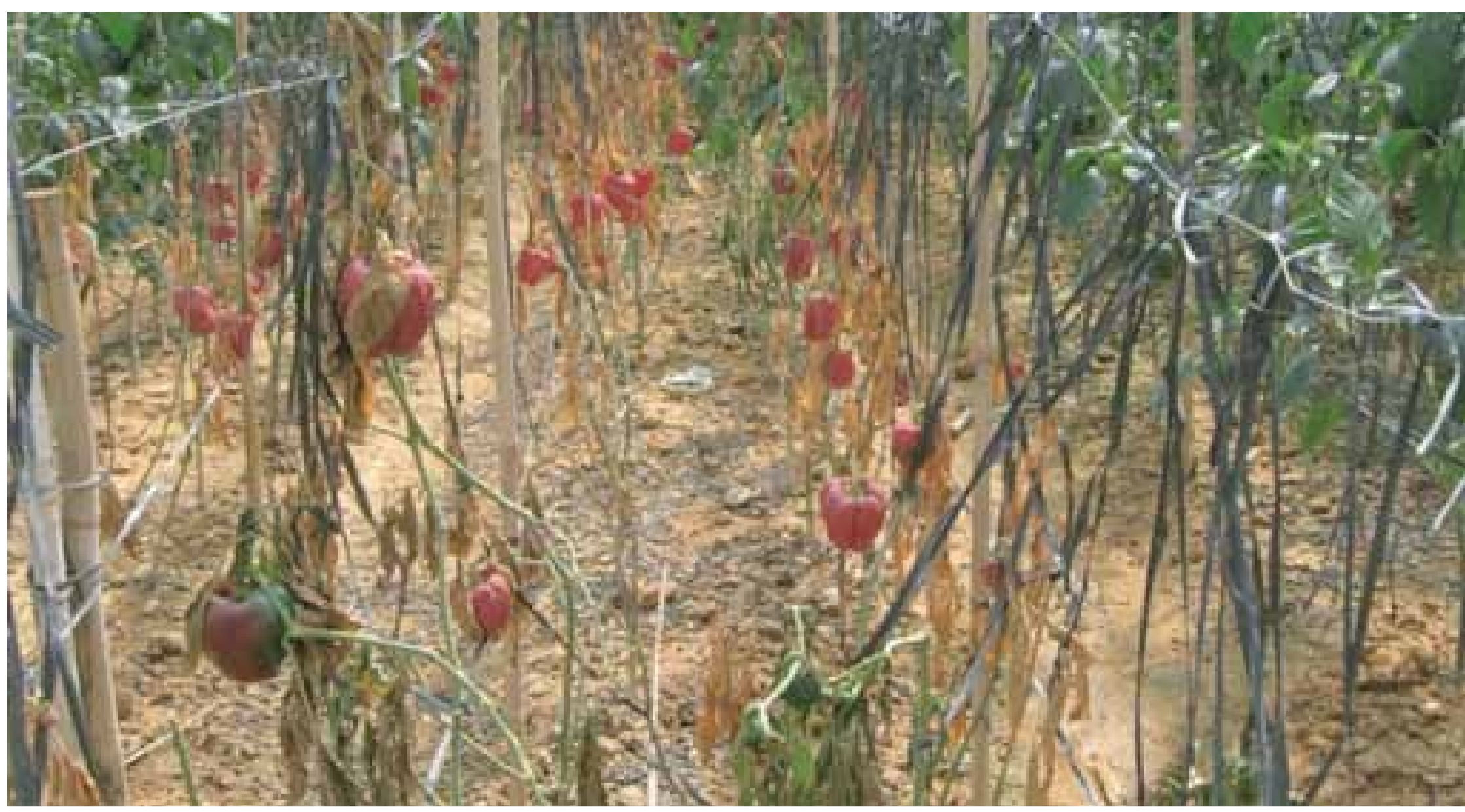
Thiệt hại do bệnh héo rũ