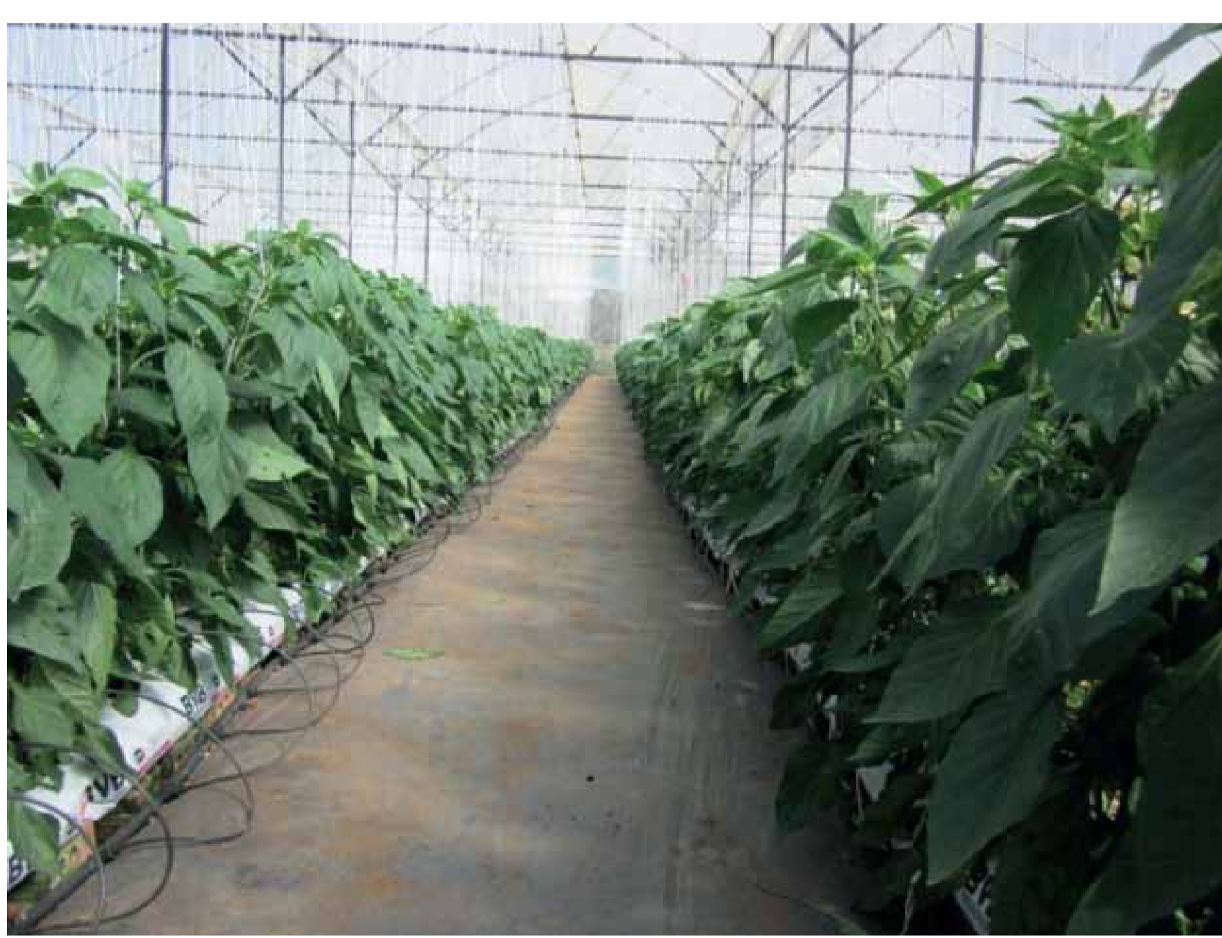
Trồng trên giá thể nhập khẩu