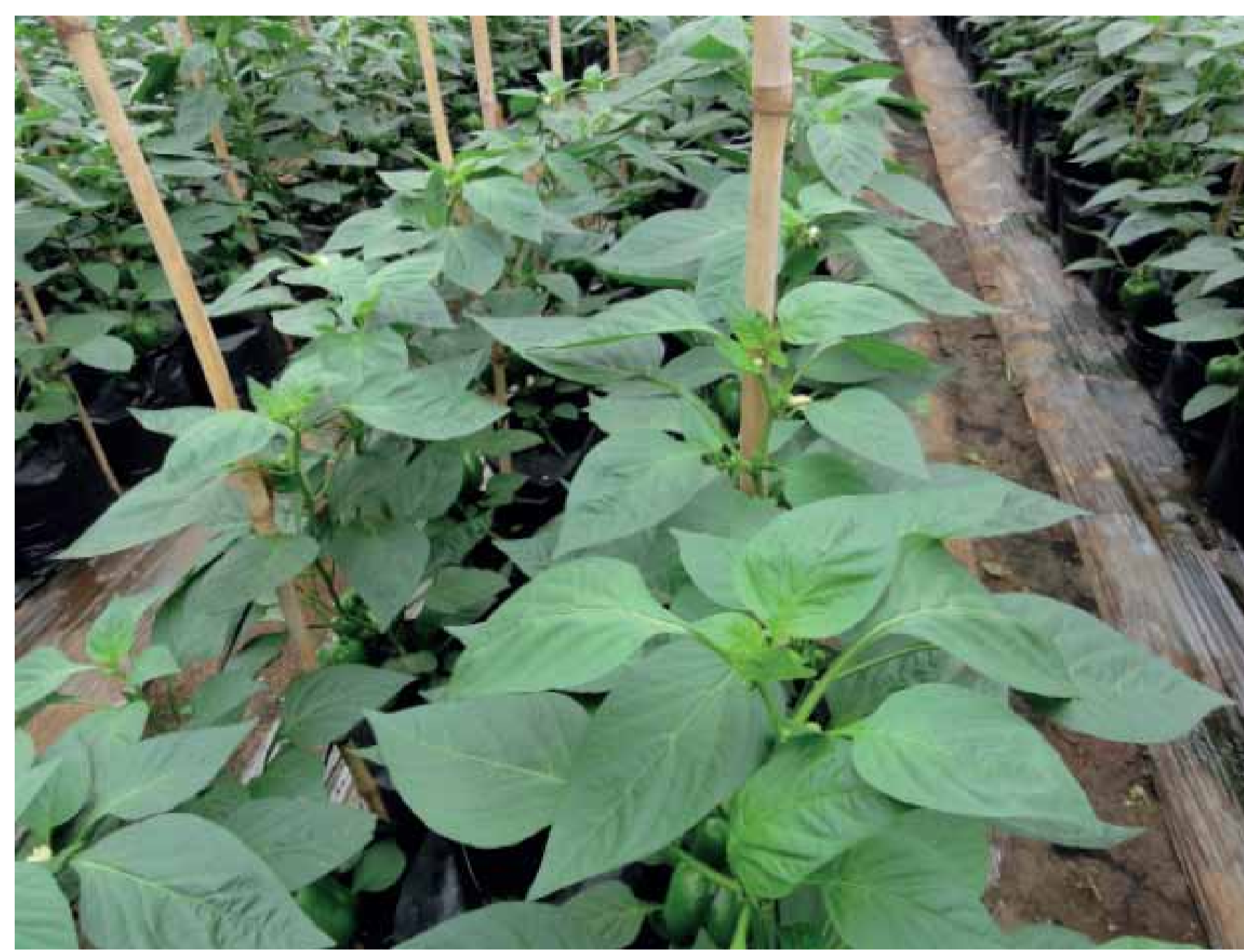
Trồng trên than trấu